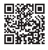
「接種予約サイト」 二次元コード

「接種予約サイト」サイトアドレス： https://v-yoyaku.jp/271004-osaka